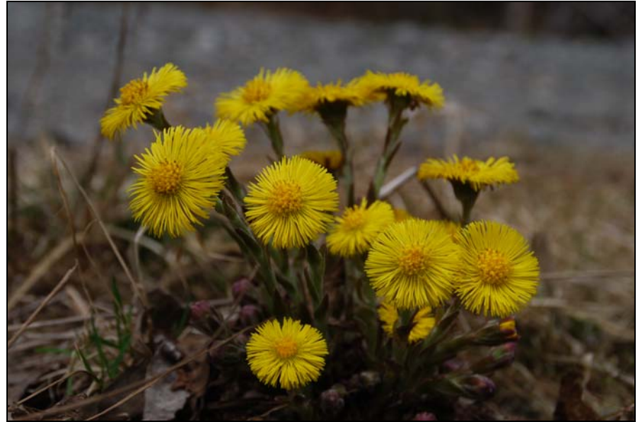
Bilde 2 Hestehov