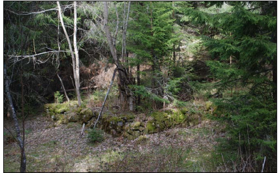
Bilde 1 Ruinene på Nordås. Post 6

I 2006 hadde vi Sørås som mål. Da bør vi vel også besøke finneboplassen Nordås. Følg Svenåveien fra Esso og deretter Opperudgata til trafikkskilt som forbyr bilkjøring videre. Følg grusveien til enden av jordet på venstre side. Noen meter etter innkjøringen til Dølenga, tar en liten sti av til venstre. Stien blir populært kalt for "Kjærringræva". Følg denne til du kommer til skogsbilveien. Følg skogsbilveien oppover. Du passer en grønmalt benk underveis. Flott utsikt. Etter ca 1 km på skogsbilveien, er det en liten åpen plass på venstre siden. Her ligger også noe "bortkapp" av tømmer. 70 m forbi denne plassen, er det gode spor etter en skogsmaskine inn til høyre. Følg disse sporene ca 200 m og du er på posten og Nordås. Fortsetter du rett fram litt over 100 m, finner du hustuftene.