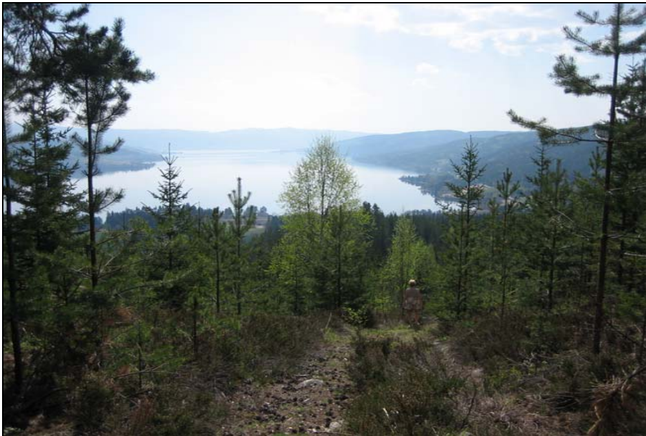
Bilde 3 Fra Onsberget. På vei ned fra post 10

Posten ble også brukt i 2006. Ta av Vestsideveien ved Halvorsbøle og følg bilveien mot Tangnes. Ca 150 m etter veibommen og i første høyresving ser du en kjerrevei som går opp til høyre. Etter 50 m og etter 150 m deler veien seg og du holder til høyre i begge kryss. Etter ca 500 m deler veien seg i 3. Følg den i midten. Etter nye ca 400 m tar en svak sti av til venstre og ved å følge denne kommer du ut på kanten av stupet. Følg stien på kanten av stupet forbi "fortoppen" og en stor steinhelle. Litt vindfall, men etter hvert kommer du til toppen. Posten er plassert på restene etter et trigonometrisk punkt.